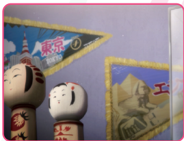
旅行に行くとき三角のペナントを買ってきてしまう。