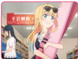
衣装製作の布屋さんはマプチ本店をイメージして作画してもらいました。