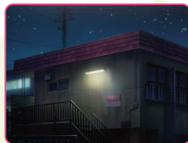
冒頭シーンの年季の入ったアパートはあんこの年齢と同じ築年数である。