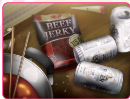
一人暮らしが長いせいか、インスタントラーメンは、鍋で食べてしまう。