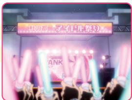
ライブシーンは仙台市の勾当台公園・野外音楽堂をイメージしています。