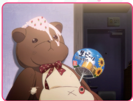
部屋着に着替えるとすぐに下着を外れくまのぬいぐるみにかける癖がある。