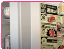
冷蔵庫には近所のスーパーの特売チラシが赤丸チェック済み!マグネットは、モチのロン炭酸麦茶。