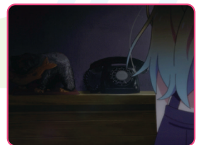
アパートの入り口には熊の置物や黒電話が置いてある。