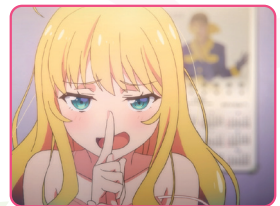
自宅には大好きな森高さんのカレンダーが飾ってある。