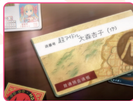
あんこはゴールド免許の持ち主で、通帳に「超アイドル」と書いてしまう。